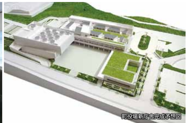
町役場新庁舎完成予想図