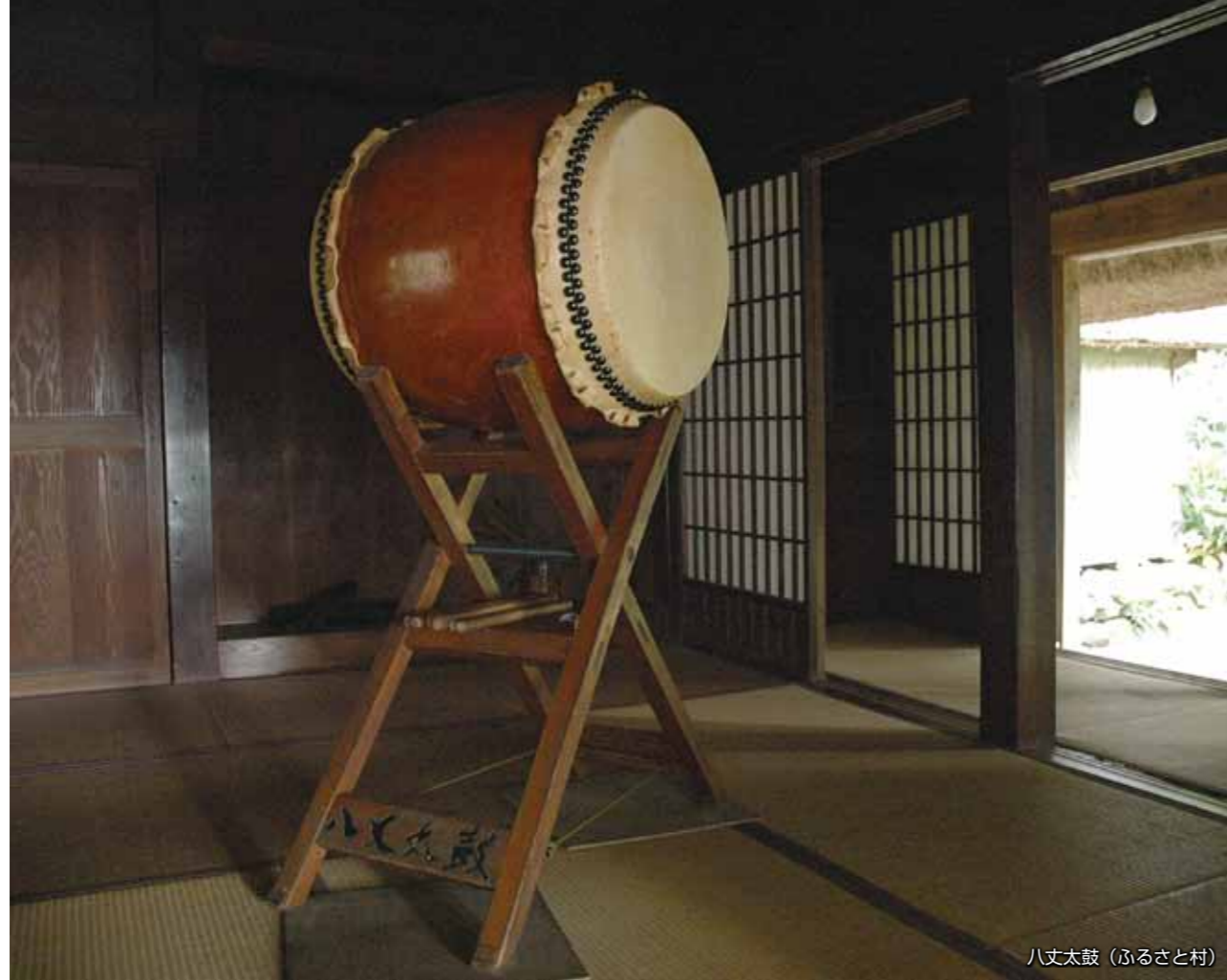
八丈太鼓 (ふるさと村)

八丈太鼓や黄八丈に限らず、この島の各地に残る遺跡、伝承されてきた歴史、そして有形無形の文化はすべて私たちのかけがえない財産です。歴史と文化を探求すればするほど、島の貴重な財産としての価値がいつそう高まり、これを生かすことが、必ず「地方の時代」における島の発展につながります。