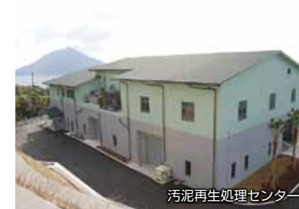
汚泥再生処理センター