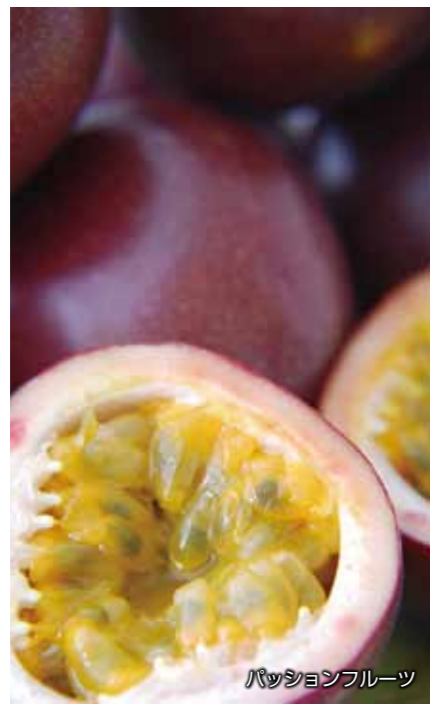
パッションフルーツ