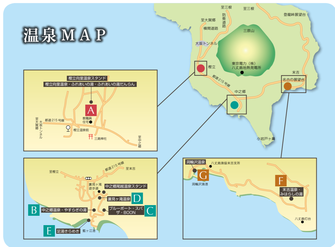
C ブルーポート・スパ ザ・BOON