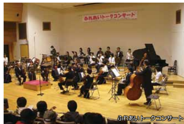
ふれあいトークコンサート

「住民が中心になり、住民の力に基づき、住民の願いを実現する。」住民主役の町づくりを目指します。