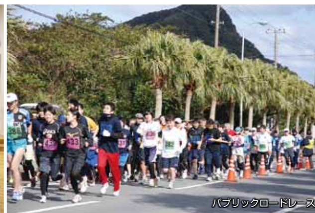
パブリックロードレース