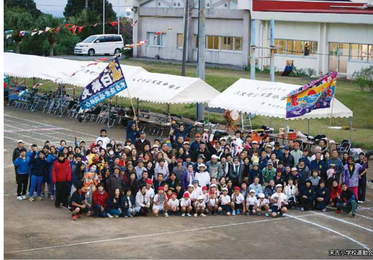
末吉小学校運動会

「住民が中心になり、住民の力に基づき、住民の願いを実現する。」住民主役の町づくりを目指します。