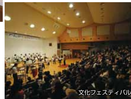
文化フェスティバル